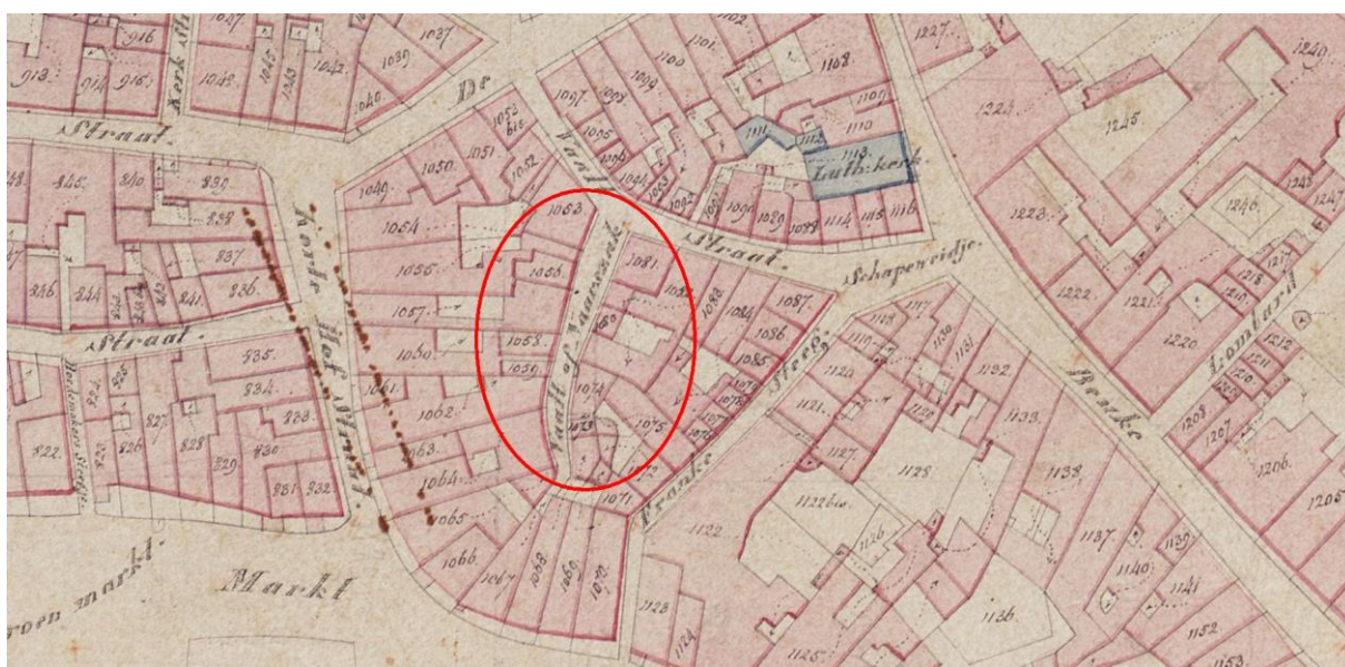
“Hoe oud is de Naadzak en hoe komt hij aan zijn naam?” (fotonummer SZU005000189)