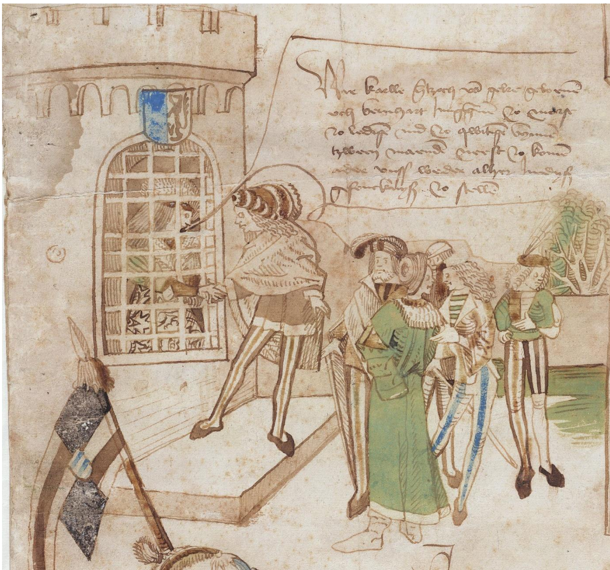
"Hallo, Kunt u mij zeggen of er een kerker bestaat in Zutphen?"

De 'kindervitrine' in het Stedelijk Museum Zutphen heeft een nieuwe boost gekregen. Op 6 mei onthulden we de eerste 'Jeugdschatten', van een archeoloog in de dop. De twaalfjarige jongen gaf de gasten bij de onthulling vervolgens zelf een rondleiding door het museum.